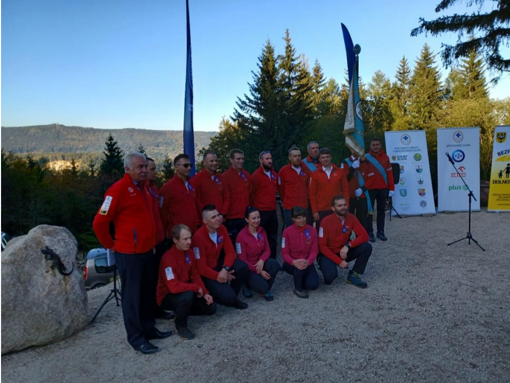
Nowi ratownicy GK GPR w towarzystwie Naczelnika i Prezesa